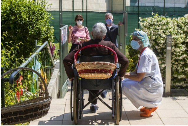
Virus e persone con handicap in carrozzina

Intervista a Renzo Andrich, ingegnere esperto di ausili tecnologici per le persone con disabilità, chiamato dall'Organizzazione mondiale della sanità a lavorare in un progetto internazionale sugli ausili tecnici considerati il "quarto pilastro" della strategia della salute